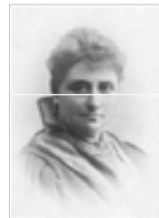
GINA KROG (1847 – 1916)