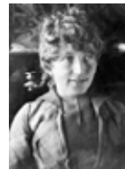
IDA CECILIE THORESEN (1858 – 1911)